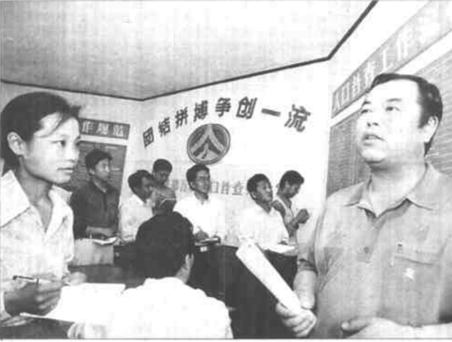
利津县按照上级统一要求和部署，积极筹备人口普查工作。目前，该县人口普查办公室工作人员已全部到位，制定了详细实用的工作流程，并对人口普查员进行了培训。